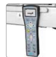
Пульт управления беспроводной