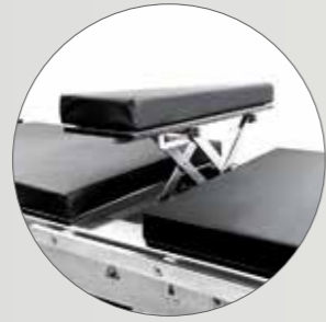
Электрический почечный валик в спинной секции