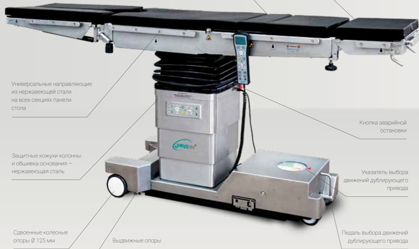
Универсальные направляющие из нержавеющей стали на всех секциях панели стола