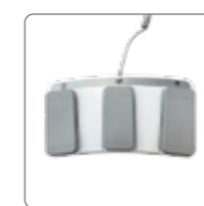
Пульт управления педальный