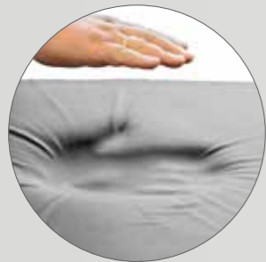
Вязкоупругий матрас с памятью (40 мм)