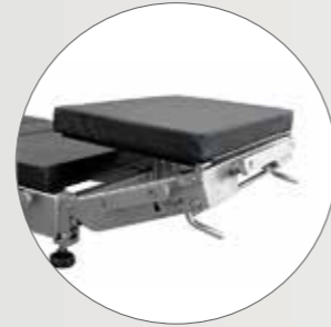
Головная секция с функцией двойного наклона